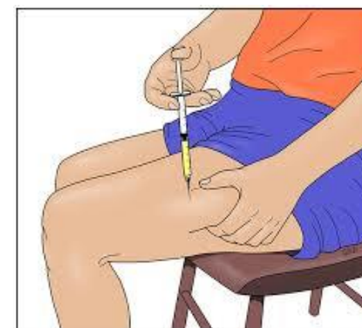
محل تزریق انسولین در ران

به یاد داشته باشید قبل از تزریق دارو تاریخ انقضای آن را چک کنید.